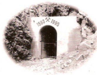
Das Mundloch der Erzgrube „Untere Sophia“, 1995 von der Dorfgemeinschaft Friedrichstal gefunden und freigelegt (Station 9).

Mit einem Alter von rund 240 Jahren ist Friedrichstal einer der jüngsten Teilorte der Gesamtgemeinde Baiersbronn – die menschlichen Aktivitäten in diesem Gebiet sind jedoch sehr viel älter: Bergbaus Spuren zeigen, daß in diesem Gebiet schon vor tausend Jahren nach Erzen gesucht wurde. Im Christophstal wurde ab 1550 das Erz vor Ort verarbeitet.