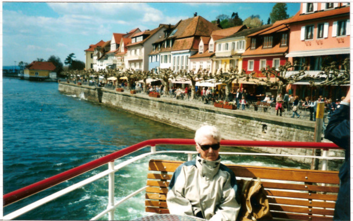
Rückfahrt mit dem Schiff Insel Mainau - Meersburg - Konstanz