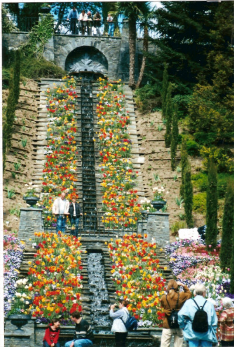
Italienische Blumen - Wassertreppe