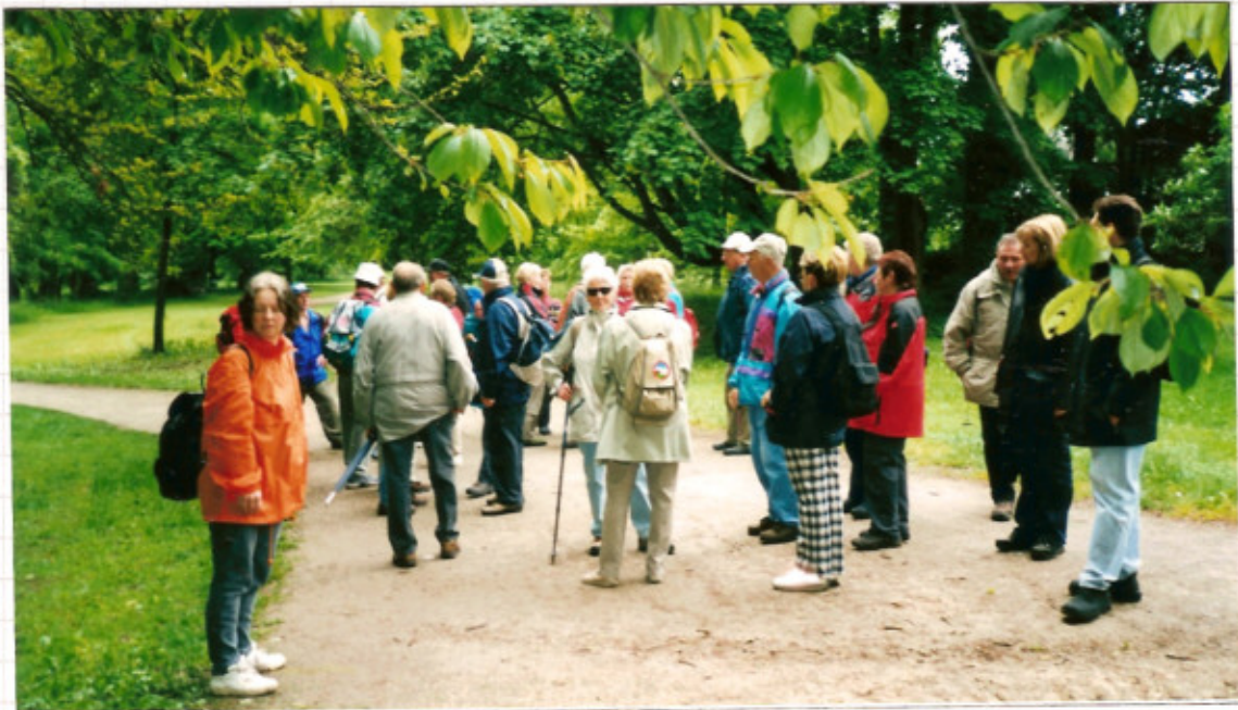
Wanderung: auf dem Bodenseewanderweg, von Konstanz bis zur Insel Mainau ca. 12 km. Der Weg ist 270 Kilometer lang und umrundet das Schöbische Meer nah am Wasser.