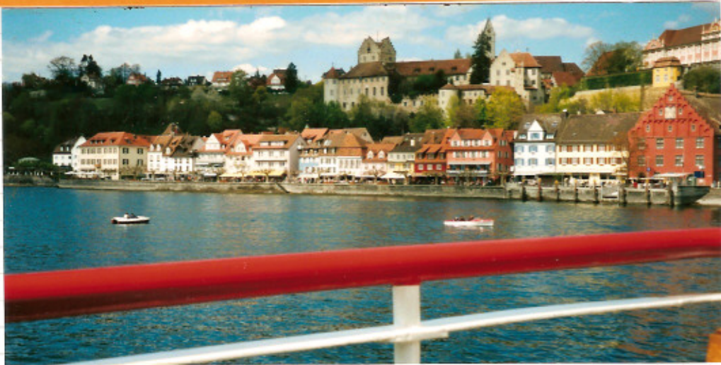
Eine Seefahrt die ist lustig, eine Seefahrt die macht froh, wenn mann nett schlofe dut.