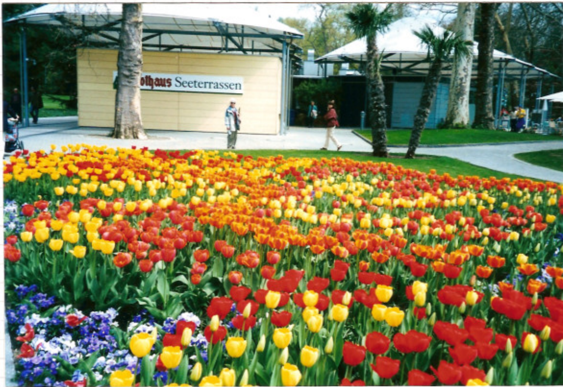
VORTOUR 9. Mai 2004 MAINAU BLUMENMEER AUF DER INSEL. Indiesen Frühlingstagen über wältigen die weniger exotischen Gewächse jeden Besucher. Die Park und Gartenanlagen zeigen mit 1,2 Millionen Frühlingsblumen ein Blütenmeer von atemberaubender Pracht.