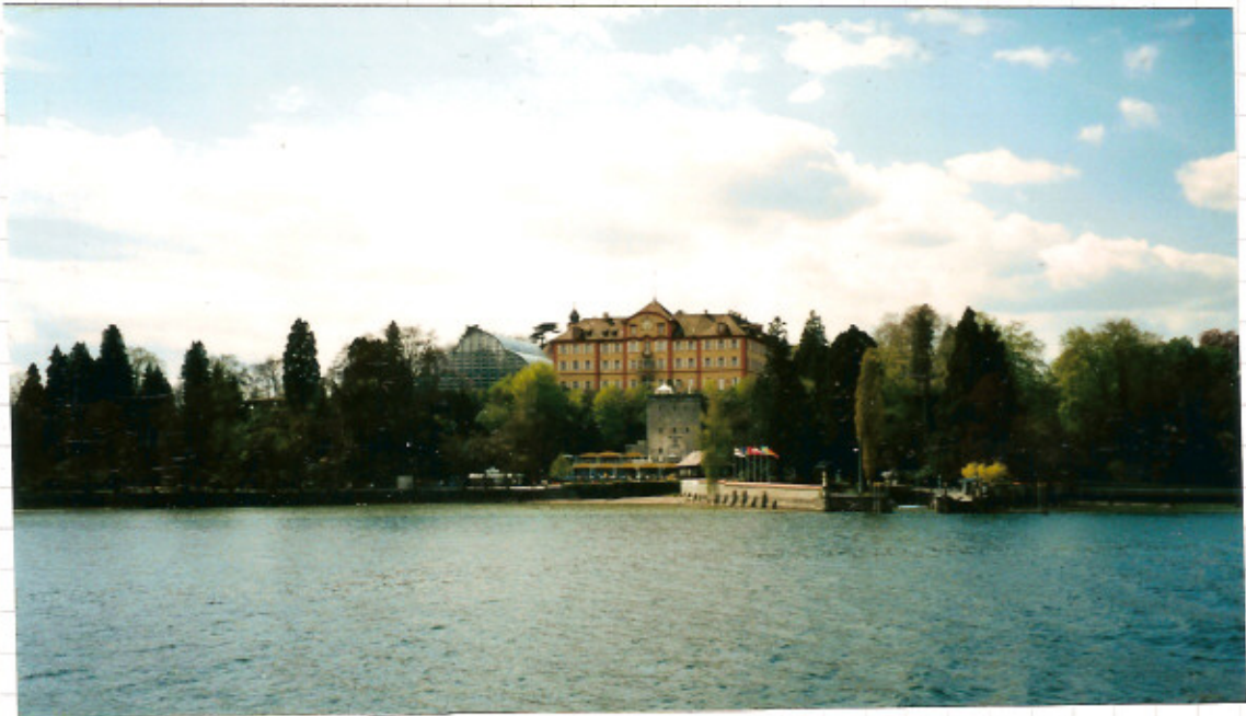
Schloss - Mainau