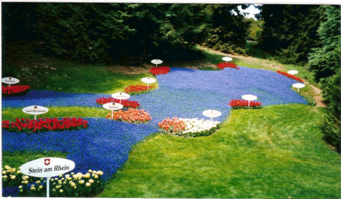
Bodenseerelief - Ufergarten