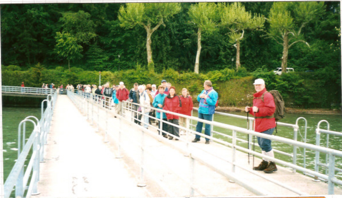
Rückfahrt mit dem Schiff von der Insel Mainau nach Konstanz