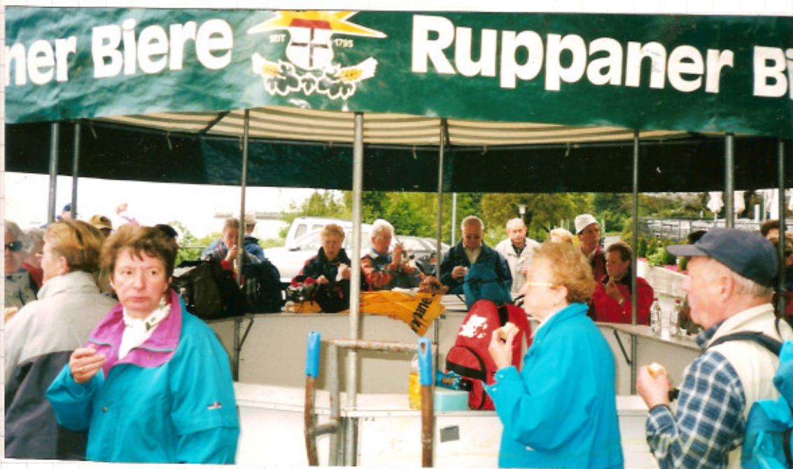
Großer Durst aber kein Ruppaner Bier