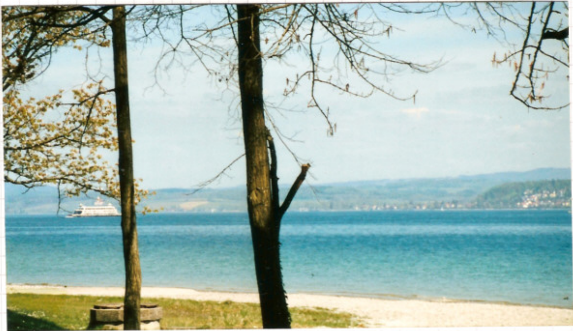
Autofähre Staad - Meersburg