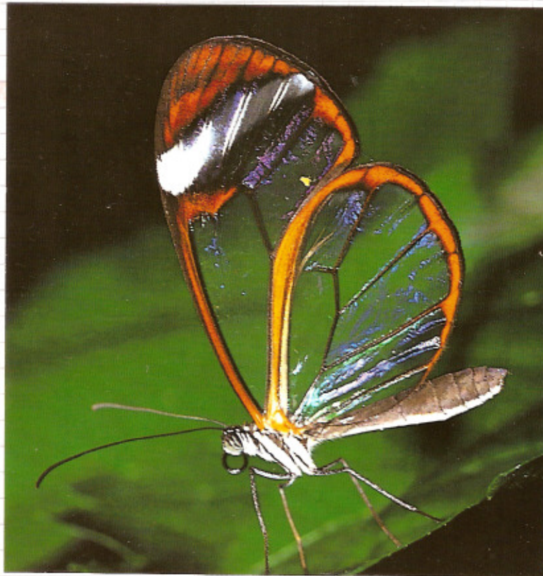
Im Schmetterlingshaus einmalig schöne Schmetterlinge