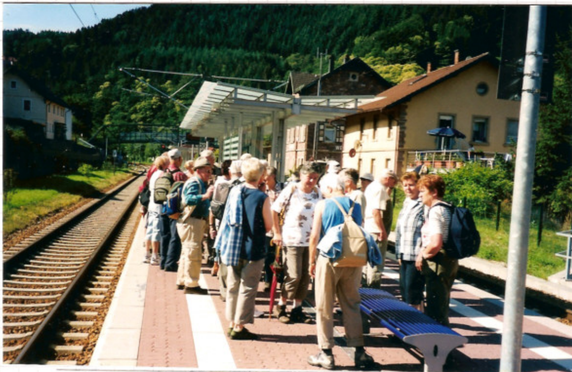
Immer großer Bahnhof bei der Ankunft in Weisenbach.