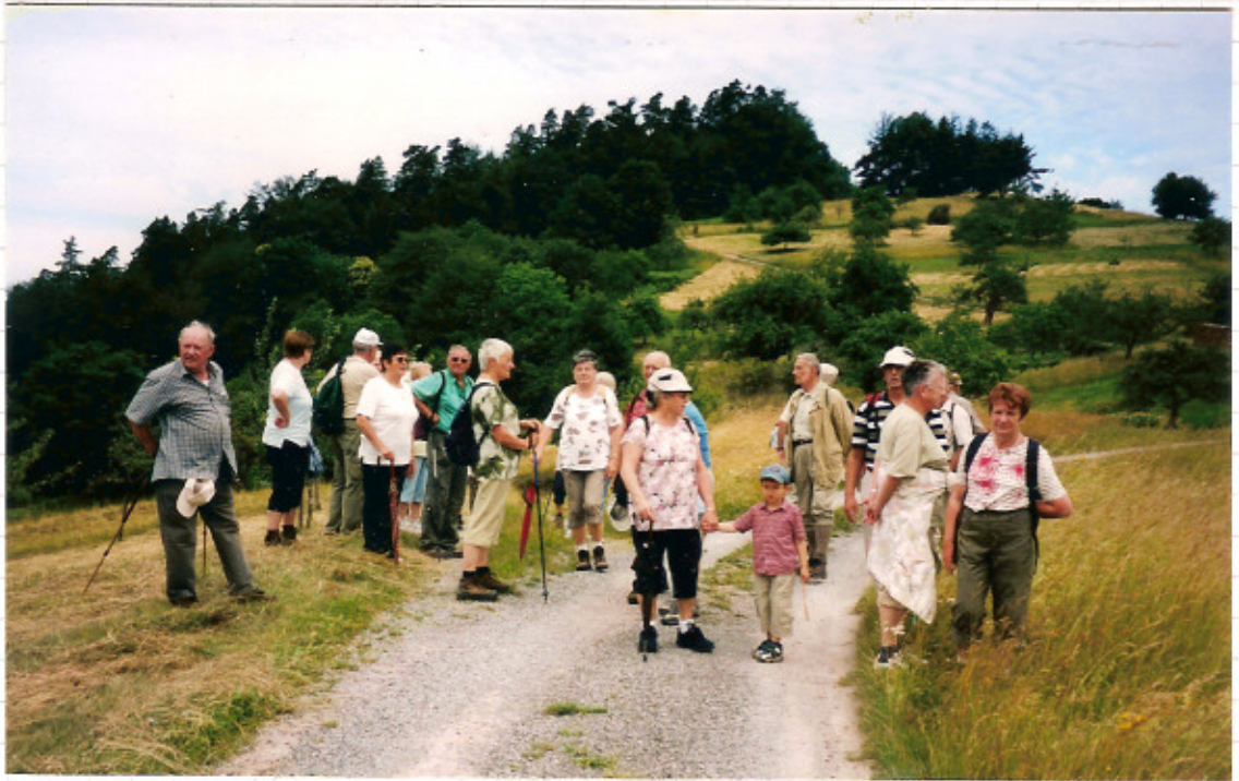
Rast auf der Reichentaler Ebene.