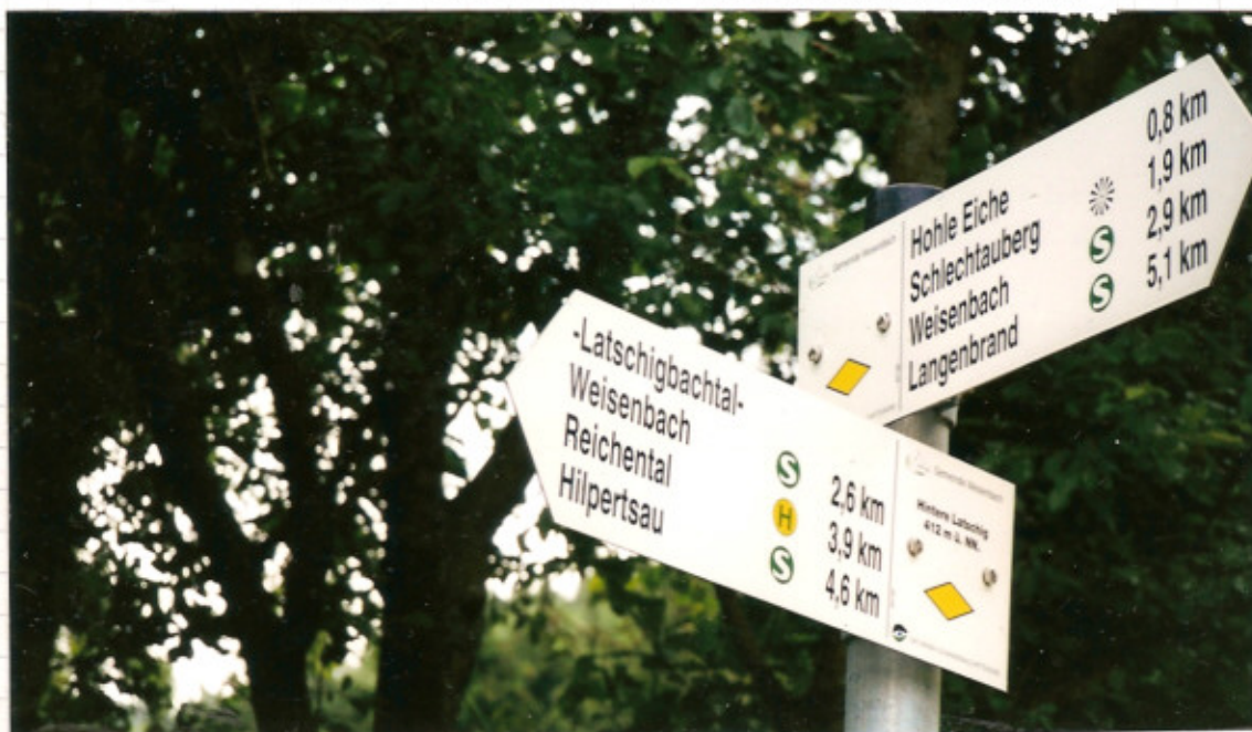
Über die neue Beschilderung mußten die Wanderfreunde aus Bretten staunen.