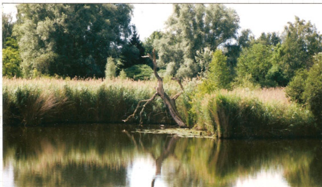
Der Badische Dschungel, Lebensraum Auenwald