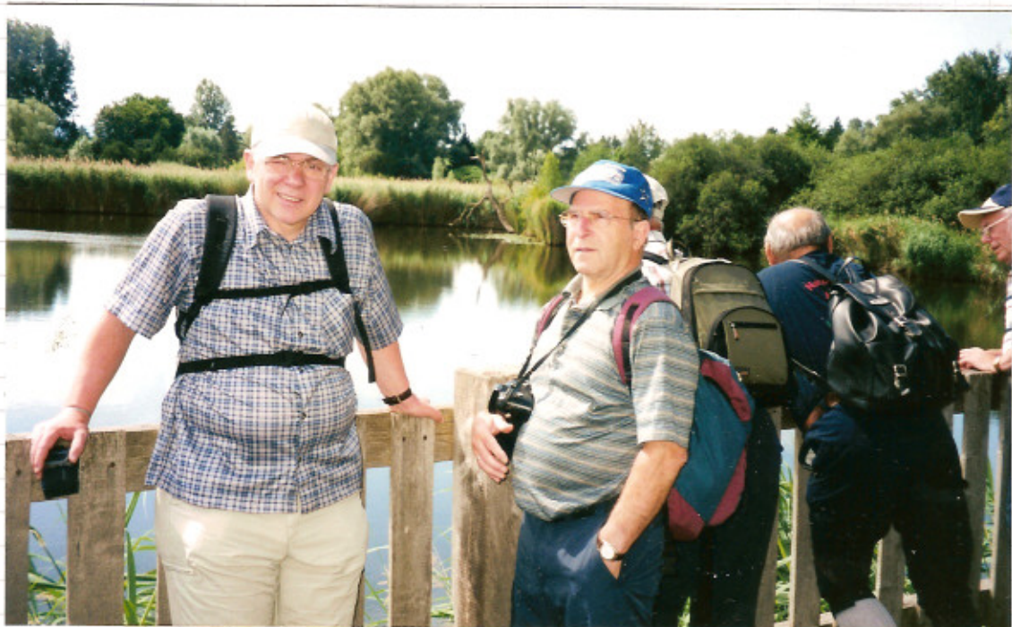
An den Saunseen entlang Richtung Auwald