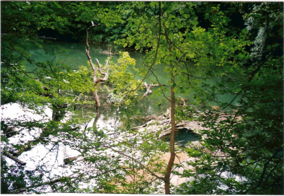
Naturerlebnis Rheinauen bei Rappenwört