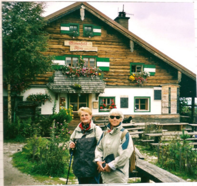
Mittenfeld - Alm 1698 m