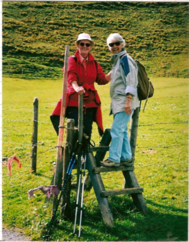
Lichtensteinklamm bei St.Johann im Pongau.