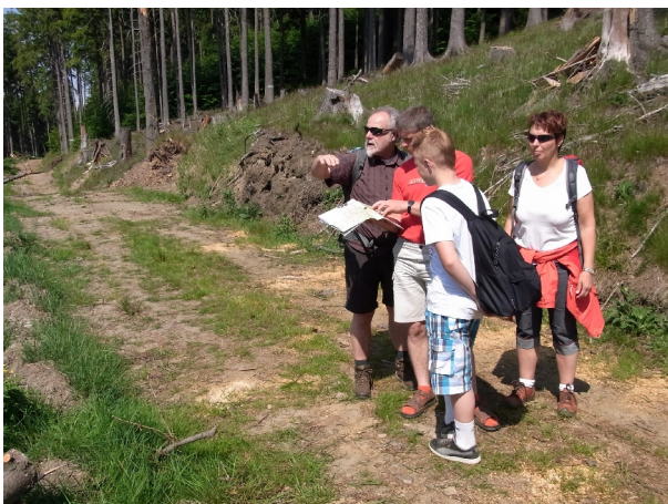
Mhmmm, welchen Weg nehmen wir?