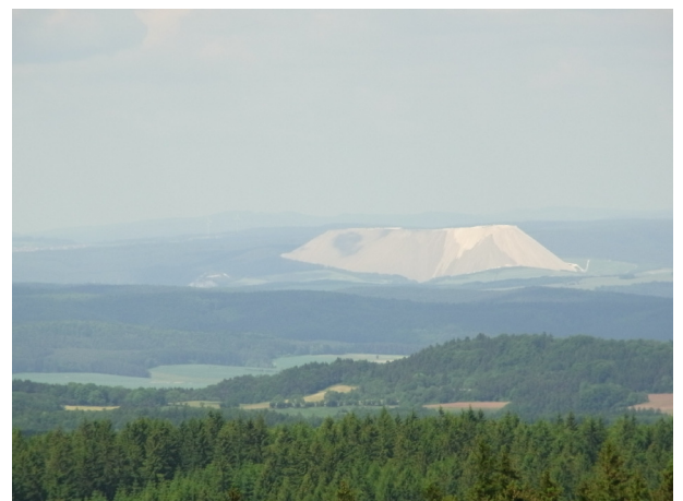
Die weithin sichtbaren Kaliberge