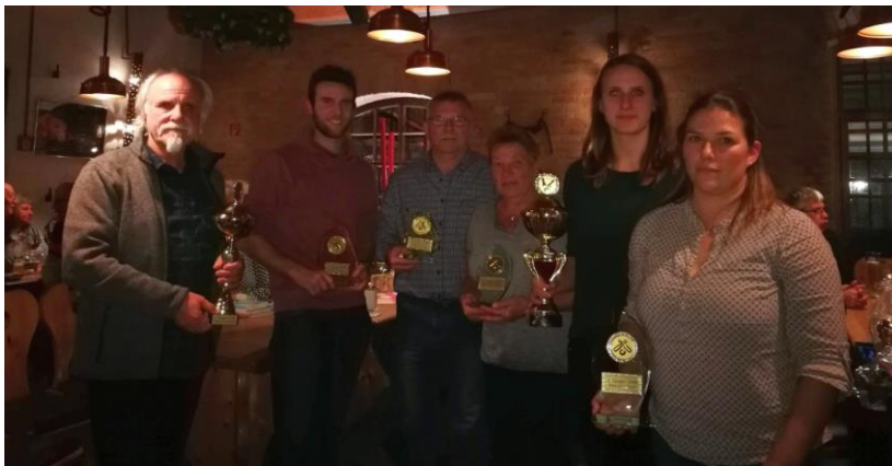
Die Kegelgewinner 2018

Unsere Auer Mannschaft bekam auch einen Ehrenpokal